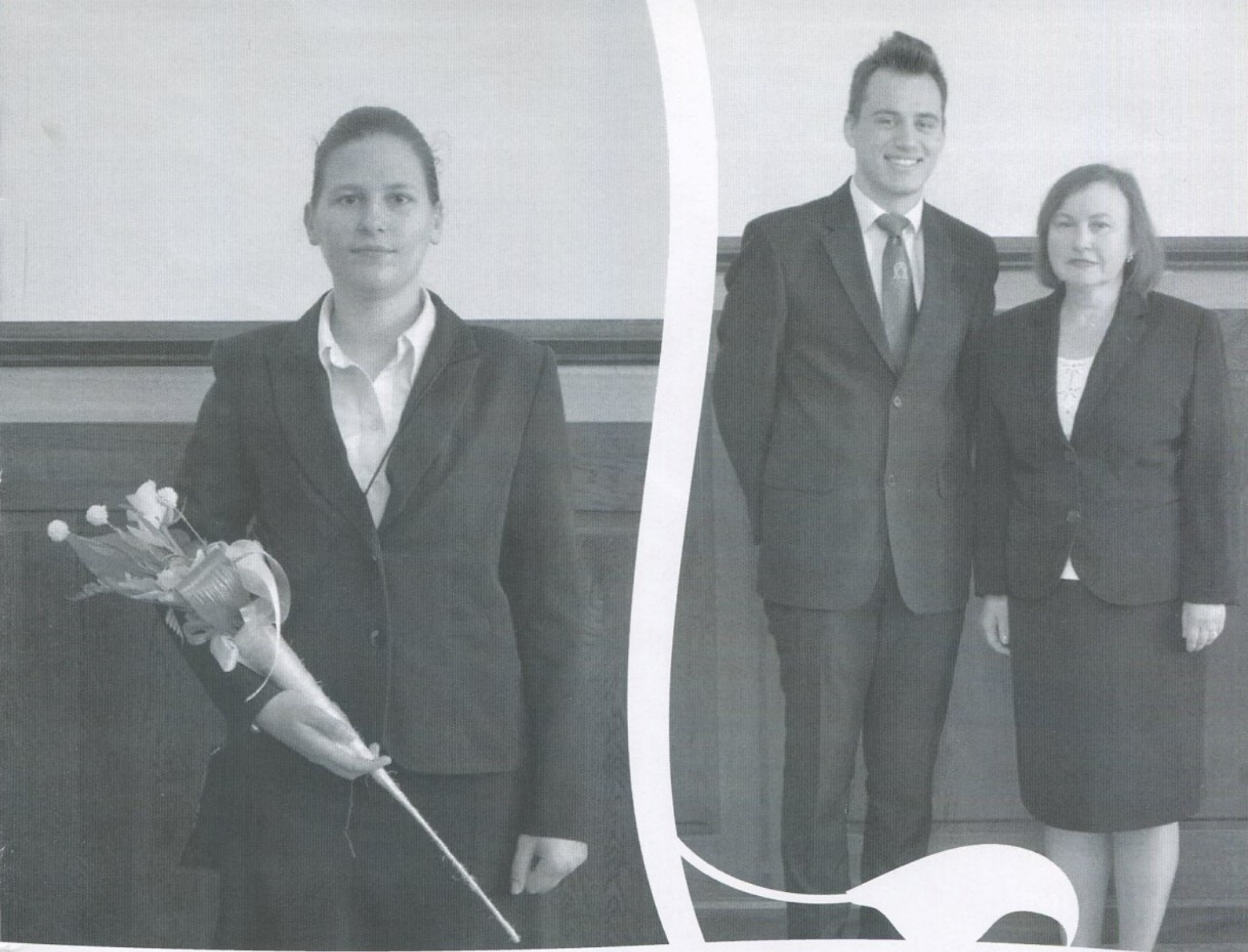
A Tiszáninneri Református Egyházkerület díjazottjai