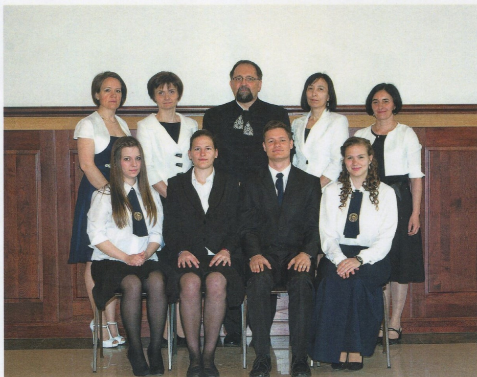
Lévy közösségi díjasok (Pro Scola et communitate)