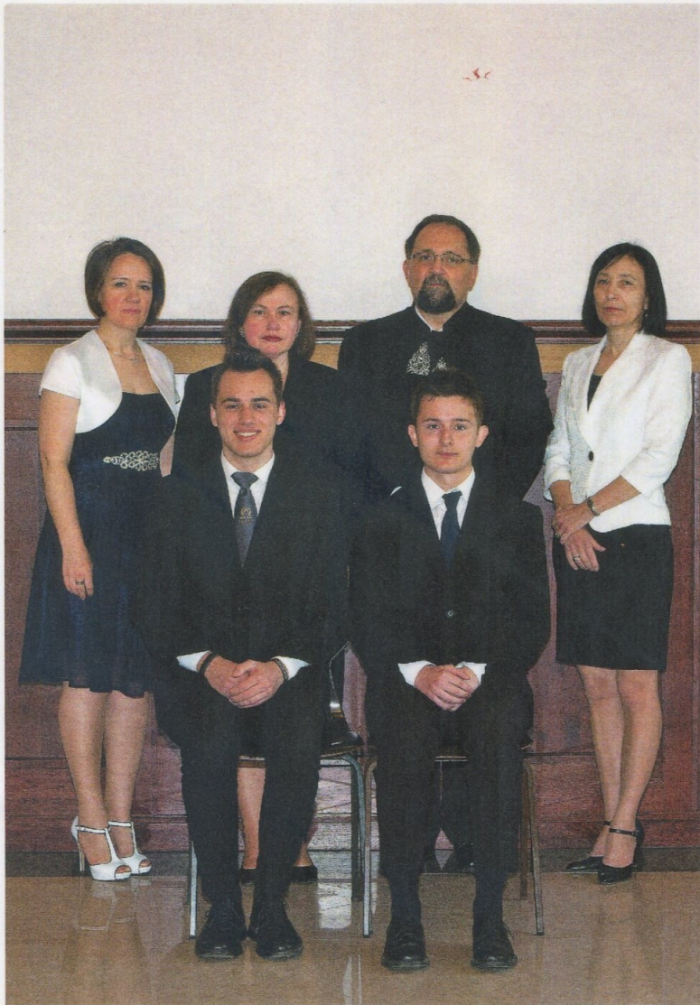
Lévy kiválósága díjasok (Pro Exellentia)