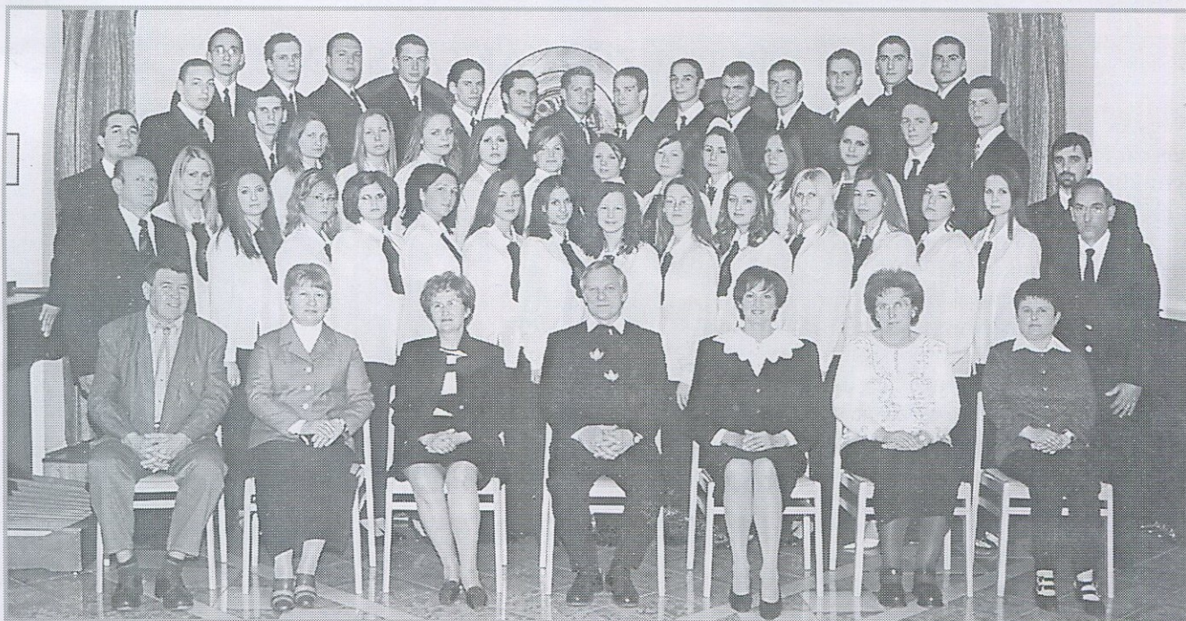
A Tóth Pál Diákotthon végzős diákjai a 2004-2005-ös tanévben a nevelőtanárokkal

felejtétek el a Mindenhatónak a biztatását, aki azt mondja " Ne félj, mert én veled vagyok, meg-