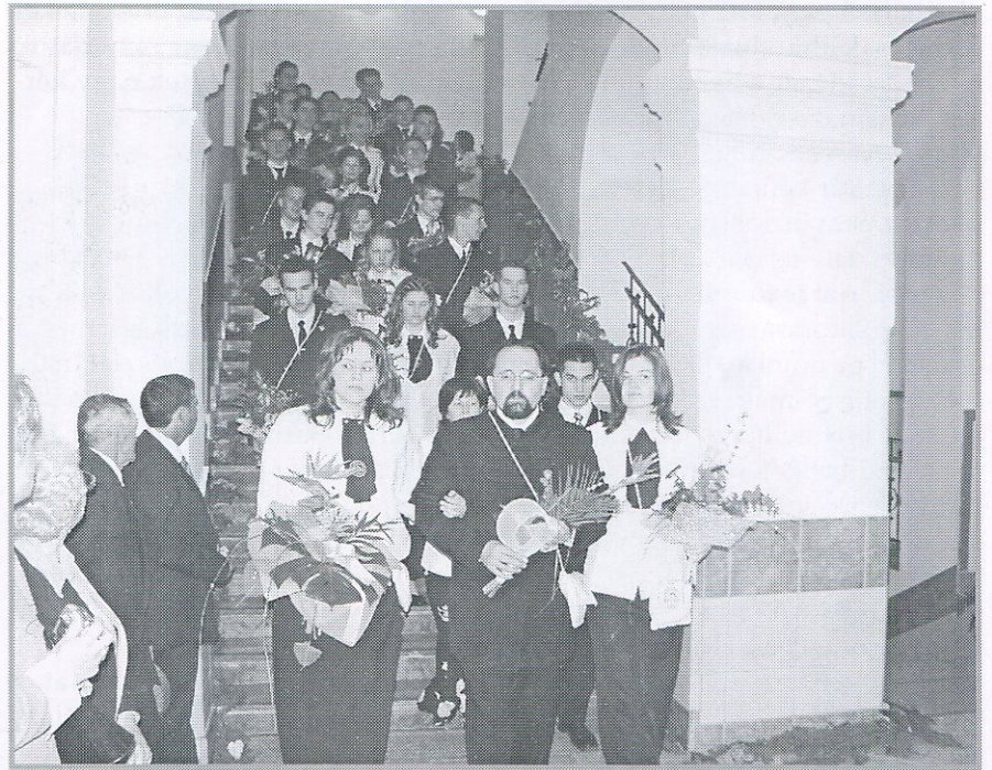
most búcsúzunk és elmegyünk a mi időnk lejárt

A kezdeti megilletődés után viszonylag gyorsan magatokra találtatok, és kiderült, hogy az egyik osztály még az átlagosnál is nyüzsz-