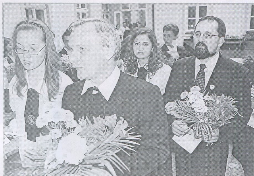
"Ballag már a tén diák" második otthonától, a kollégiumtól az intézmény vezetőivel