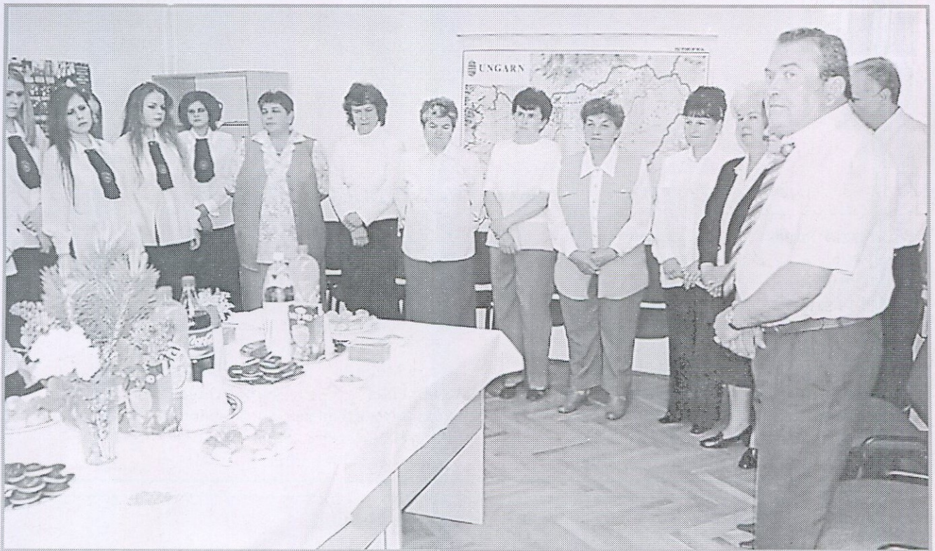
Búcsú a portásoktól és a takarító néniktől Köszönet a mindig tiszta kollégiumért és a portákszobában a jó beszélgetésekért